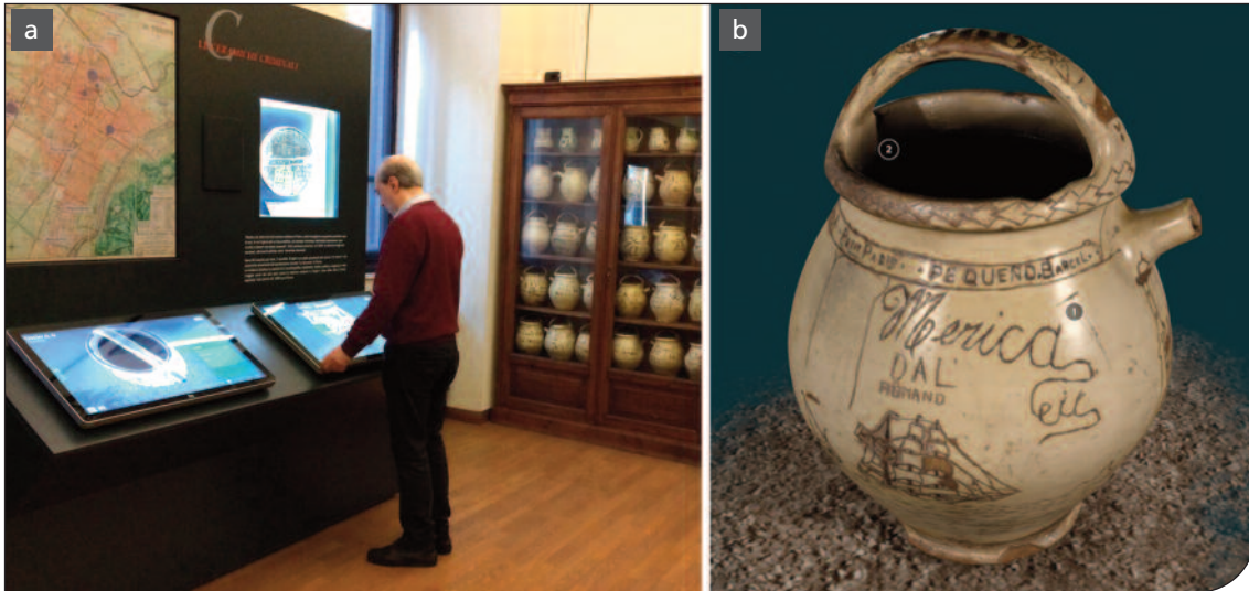
Fig. 2. Museo di Antropologia criminale "Cesare Lombroso". a) Postazione con i due monitor touch per poter vedere tutte le ceramiche in versione 3D. b) Elaborazione 3D di un orcio. Sono visibili (nei tondi) i numeri 1-2 che corrispondono agli approfondimenti