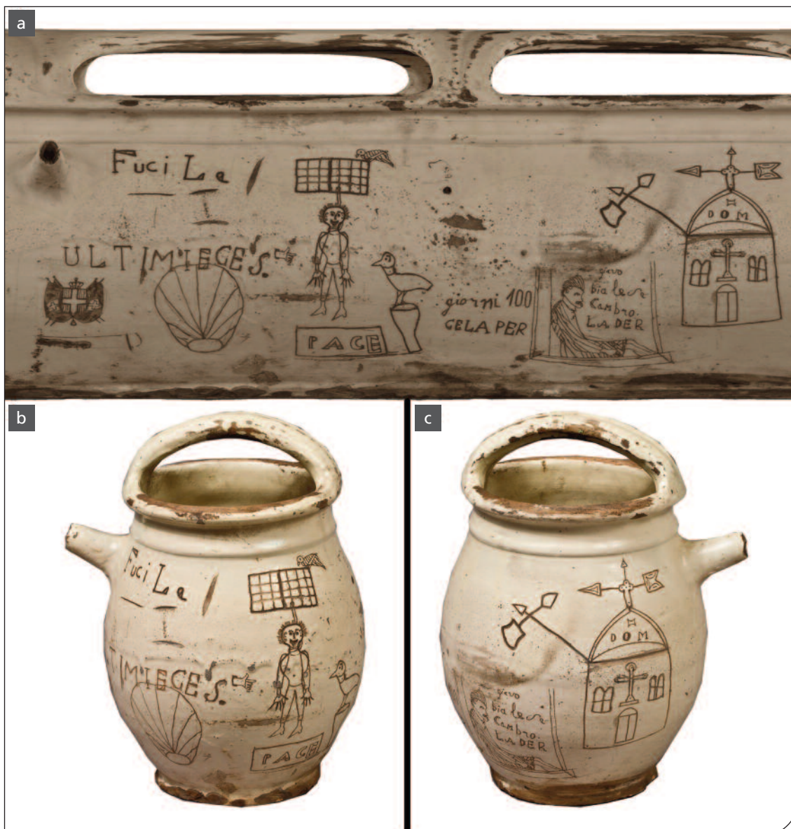
Fig. 3. Museo di Antropologia criminale "Cesare Lombroso": orcio inciso da Giovanni Cavaglià detto Fusil.

a) Immagine "piana" dell'orcio a seguito dell'elaborazione 3D.