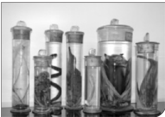
Fig. 2. Sistema Museale di Ateneo (Pavia).

La sezione di zoologia, l'unica al momento fruibile