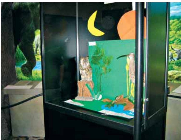
Foto 4. Una delle vetrine realizzate

Affinché la realizzazione dell'esposizione sia davvero stimolante, occorre che questa sia preceduta da un ragionamento sugli oggetti da esporre, una ricerca di relazioni implicite tra questi, una scelta di significati da illustrare, una programmazione su come disporre gli oggetti per rappresentare i concetti scelti e su come renderli comprensibili agli altri, tutti elementi che possono favorire ragionamento scientifico. Per questo, ai ragazzi è stata chiesta una progettazione accurata, da scrivere su un poster.