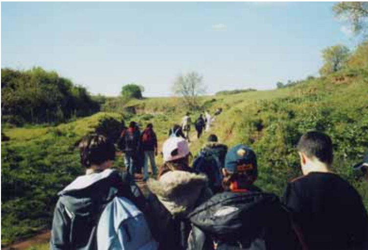
Foto 11. Un gruppo di ragazzi che ha partecipato al Progetto per la conservazione e la riqualificazione del Parco della Caffarella (Roma)

Abbiamo pertanto introdotto questo ed altri progetti simili nelle offerte educative del Museo, affrontando sempre problematiche socioambientali di gestione e conservazione. Il Parco cittadino storico-archeologico della Caffarella, ad esempio, è diventato una delle nostre mete più frequentate e l'oggetto di molti progetti di sostenibilità, per la ricchezza delle problematiche di gestione e conservazione che presenta, tra emergenze naturalistiche, storico-archeologiche ed esigenze ricreative umane.