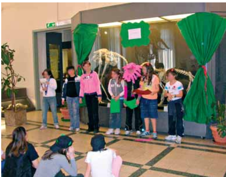
Foto 9. Un momento di una rappresentazione teatrale

Questa forma espressiva rappresenta un modo molto stimolante e coinvolgente per “far vivere” e parlare un diorama, per rendere espliciti i messaggi e costruirne di nuovi nell'ambito delle idee della scienza; è un'esperienza didattica potente, un modo attivo di leggere ed interpretare, di impadronirsi dei contenuti e rielaborarli in modo comprensibile per altri.