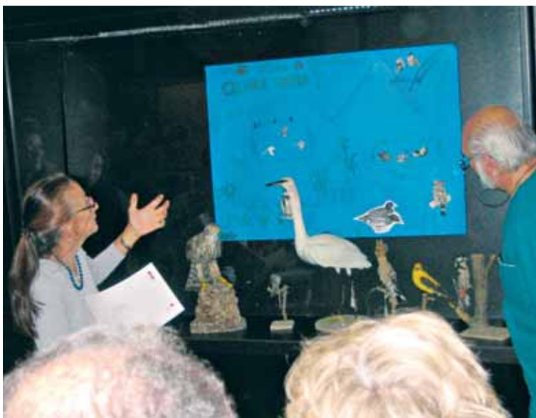
Foto 7. Discussione sulla illustrazione scientifica realizzata in una vetrina