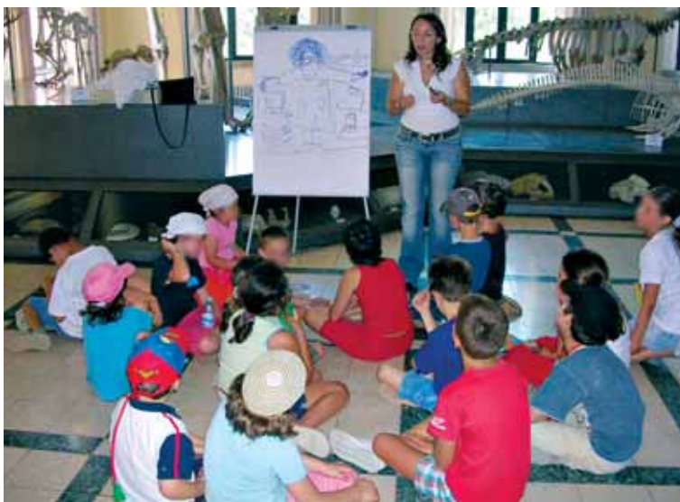
Foto 3. L'identikit dello scienziato

ATTIVITÀ - Costruiamo l'identikit dello scienziato.