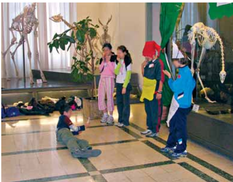
Foto 10. Un altro momento della rappresentazione teatrale

Il programma prevedeva vari “momenti speciali” delle attività museali, in “scenari” preparati appositamente: l’atelier del preparatore , che riproduceva l’attività di tassidermia, di preparazione di calchi, ecc.; il laboratorio dello scienziato , con l’illustrazione dell’attività di un biologo marino; il lavoro del conservatore , ecc..