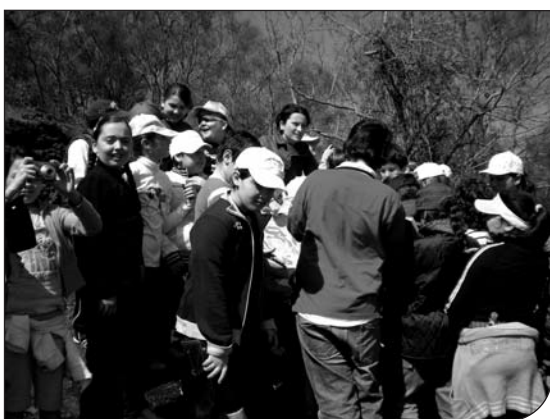
Fig. 3. Escursioni sul territorio.

culturali, contatta ed invita i rappresentanti delle istituzioni alle sedute inaugurali di importanti manifestazioni. Cura, inoltre, i rapporti con le altre istituzioni museali onde favorire costruttivi scambi di rispettive esperienze volte al coinvolgimento della cittadinanza. Istruisce pratiche per attivare forme di partenariato con istituzioni nazionali e internazionali per poter realizzare progetti scientifici e divulgativi comuni, per attuare mostre e convegni finalizzati ad accrescere l'interesse dei giovani verso la Scienza e per far conoscere ai cittadini l'importanza ed il ruolo sociale dei musei scientifici.