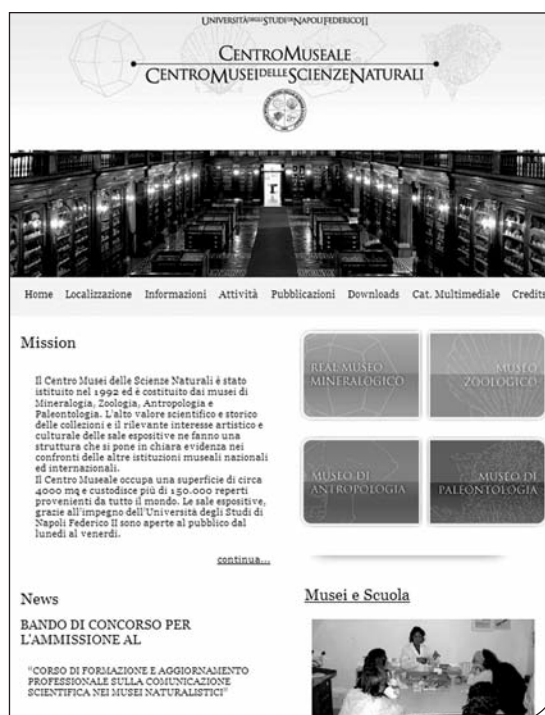
Fig. 4. Home page sito web del centro Musei.

Il sito è ancora in fase di elaborazione e sviluppo infatti è previsto l'inserimento di una sezione con sussidi