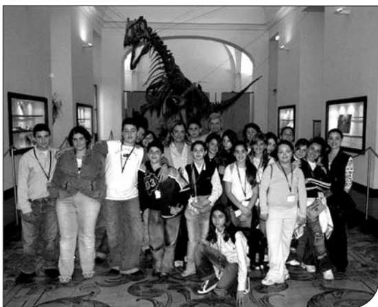
Fig. 1. Visite guidate al Centro Musei.