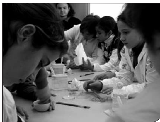
Fig. 2. Attività di laboratorio al Centro Musei.

numero telefonico (081 2537587) al fine di poter fornire rapide informazioni agli insegnanti, alle associazioni culturali, ai singoli visitatori. È stato, inoltre, messo a punto un sistema per la gestione informatizzata delle prenotazioni per le visite guidate ai quattro musei (fig. 1), per le attività di laboratorio (fig. 2), per le escursioni sul territorio (fig. 3). Questo sistema ha permesso anche di organizzare un calendario per la disponibilità delle sale museali per lo svolgimento di congressi, seminari, e dibattiti che spaziano dalle problematiche scientifiche a quelle sociali, etiche e letterarie, manifestazioni che sono rivolte a tutta la cittadinanza.