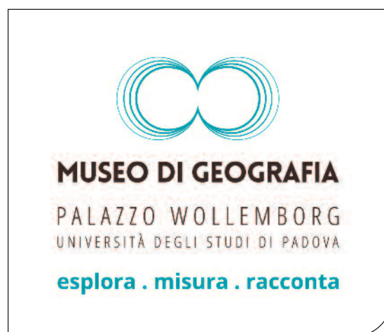
Fig. 1. Il logo del Museo di Geografia con il payoff

Le tre diverse azioni che costituiscono il payoff sono poi declinate singolarmente all'interno di ciascuna delle tre sale principali in cui si articola lo spazio museale (Varotto, in stampa). Nella prima, dedicata appunto alla "misura", i beni esposti ripercorrono le ricerche di ambito meteorologico (che videro impegnato Giovanni Marinelli già dagli anni settanta dell'Ottocento: Micelli, 2011), climatologico