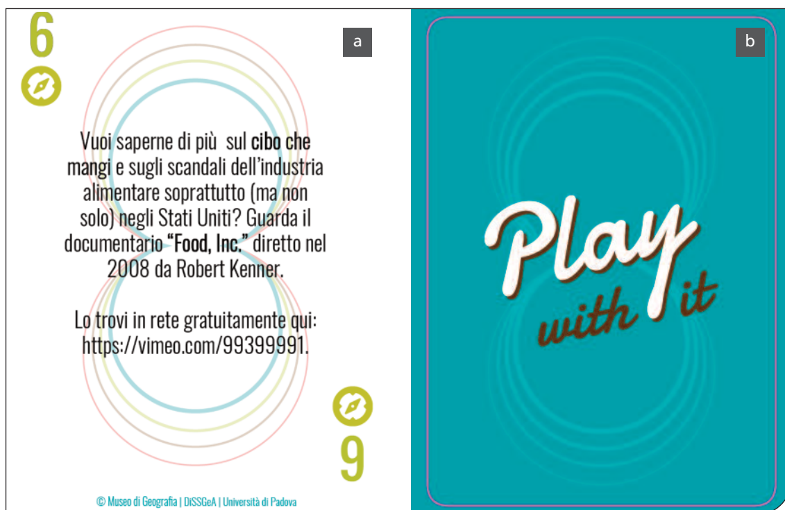
Fig. 4. Un esempio di carta da gioco con missione geografica erogata dal dispenser "Play with it"