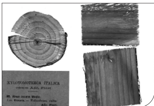
Fig. 3. Campione n° 83 ( Alnus incana ) tuttora conservato nell'allestimento originario montato su vetro.

parte delle collezioni storiche sono conservate senza cataloghi originali (Santangelo et al., 1995); dal 1986 è iniziato un lavoro di riordino e di schedatura di questi materiali (Santangelo & Nazzaro, 2004) che attualmente è in fase di chiusura (Santangelo, com. pers.). Tra le collezioni presenti presso l'erbario del Dipartimento di Biologia Vegetale di Napoli è stata recentemente ritrovata una copia della "Xylotomotheca Italica" in ottimo stato di conservazione e nella sua forma originale; tutti i campioni presenti mantengono l'etichetta originale dattiloscritta e contengono sezioni sia trasversali che longitudinali della specie indicata.