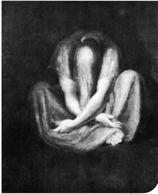
Fig. 3. Goya F., (attribuito a), "Locos en el manicomio", Museo del Monasterio de Guadalupe (Cáceres), España.

Goya, F., (attributed to), Locos en el manicomio , Museo del Monasterio de Guadalupe. Guadalupe (Cáceres), Spain.