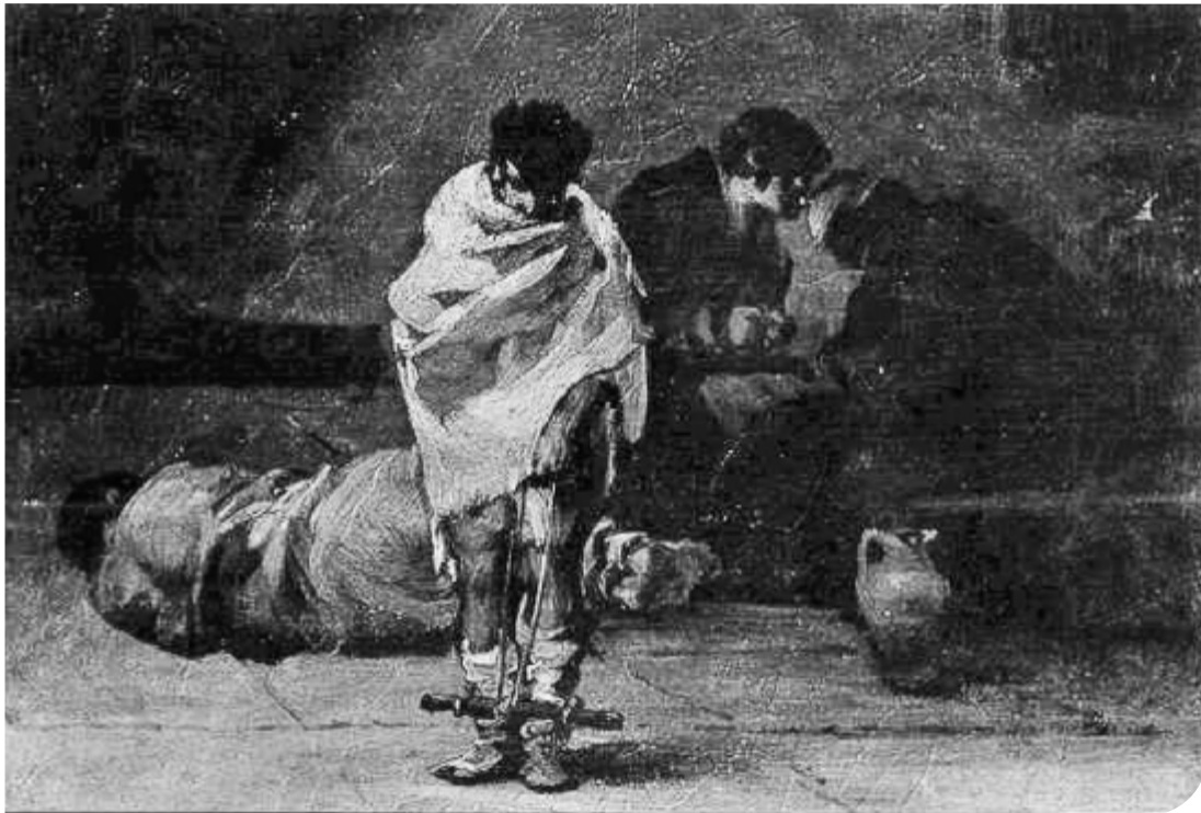
Fig. 2. Fotografia di Carla Cerati pubblicata su Morire di classe , Torino, Einaudi, 1969.

Photograph by Carla Cerati published in Morire di classe, Torino, Einaudi, 1969.