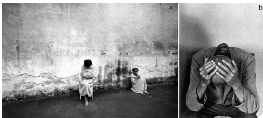
Fig. 1. a-b) Fotografie di Gianni Berengo Gardin pubblicate su Morire di classe , Torino, Einaudi, 1969.

Il secondo capitolo prende proprio in considerazione le potenzialità dell'immagine fotografica e della videoimmagine nel mostrare un'epoca passata, nel documentare il periodo o la vicenda che il museo racconta (Clemente, 2004). D'altra parte, non bisogna tuttavia dimenticare che se la fotografia ambienta il racconto della guida in un'epoca ben precisa, essa è anche frutto di una rielaborazione soggettiva della realtà. Come osservava Roland Barthes, infatti, attraverso la fotografia non ci è dato di vedere la realtà oggettiva, ma la visione di un uomo: osserviamo, per così dire, il suo punto di vista farsi immagine (Barthes, 2004). Anche la fotografia e la videoimmagine divengono allora visioni parziali della storia che, pur immortalando i luoghi di un'epoca, utilizzano particolari inquadrature ed artifici per produrre una rappresentazione soggettiva della realtà. Si pensi, a questo proposito, alla raccolta fotografica curata da Franco e Franca Basaglia e realizzata da Gianni Berengo Gardin e Carla Cerati (figg. 1,2): in Morire di classe (1969) i pazienti del manicomio di Parma