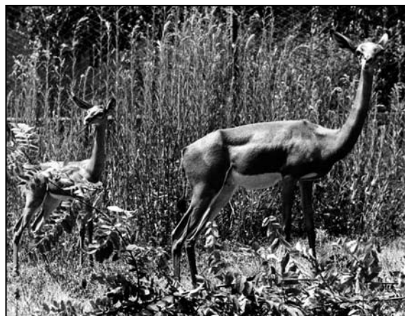
Fig. 4. Femmina con piccolo di antilope giraffa Litocranius walleri nata allo Zoo di Napoli, 1971.

Grazie anche alla creazione di una Stazione di Quarantena presso il Parco del Fusaro, il Giardino Zoologico di