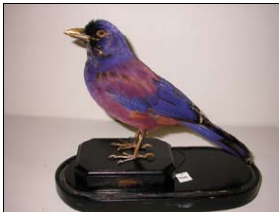
Fig. 1. Esemplare di Garrulus lidthii proveniente dal Giardino Zoologico Reale di Firenze, oggi conservato presso il Museo Regionale di Scienze Naturali di Torino. Un secondo esemplare vivo venne ceduto allo Zoo di Anversa.

Alla breve esistenza del Giardino Zoologico di Genova Nervi (1930-1940) si deve il più proficuo esempio di collaborazione tra uno zoo e un museo in Italia. Ciò è legato alla direzione congiunta del piccolo zoo e del Museo 'G. Doria' da parte di Oscar de Beaux, teriologo, già consulente scientifico presso il Tierpark di Carl Hagenbek a Stellingen, da cui aveva già riportato un certo numero di materiale per il museo genovese (Fig. 3). Praticamente tutti gli animali venuti a morte nel piccolo zoo sono passati al museo accompagnati da una affidabile identificazione tassonomica, inclusi i neonati che sono stati oggetto di diversi studi da parte di de Beaux. Quando conosciuta, ogni esemplare è accompagnato dall'età. Tra le specie provenienti dallo zoo, ricordiamo: Cervus nippon hortulorum , Mazama americana , Sylvicapra grimmia splendidula , Helarctos malayanus , Ratufa indica .